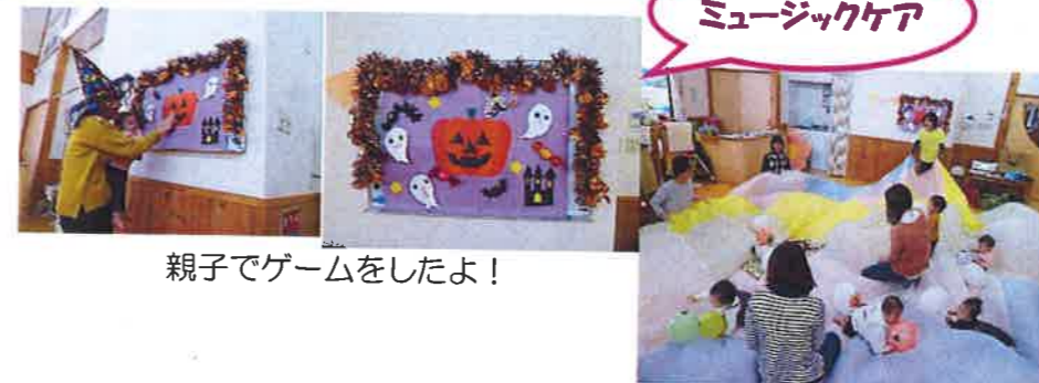
親子でゲームをしたよ！

ピアノ協会の方による、クリスマスコンサートを今年も企画しています。心地良い雰囲気親子で楽しみませんか？クリスマス会とは別の日になるので、どなたでも参加できますが、予約は必要になります。